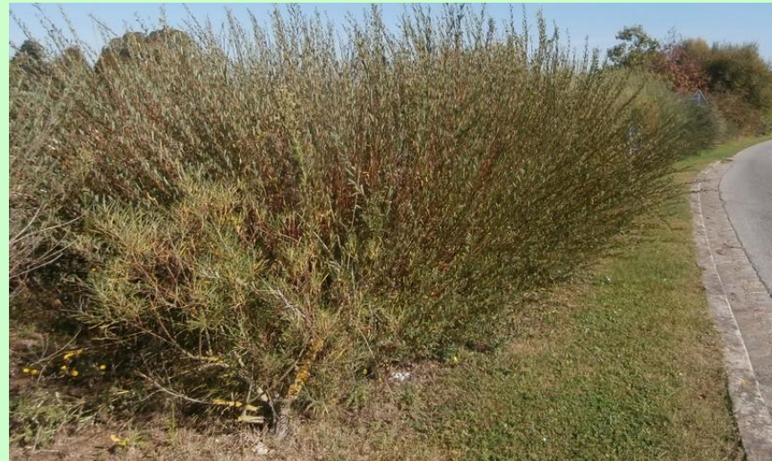
Replantation de haies en bord de route