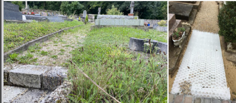
Photo 04/09/2024 - Plantations en 2017, avec un montant de 12 537 €TTC.